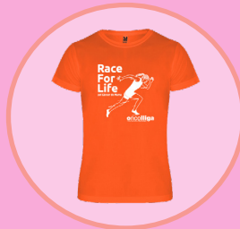
Samarreta solidària Race For Life