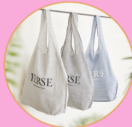
Bossa de Yerse