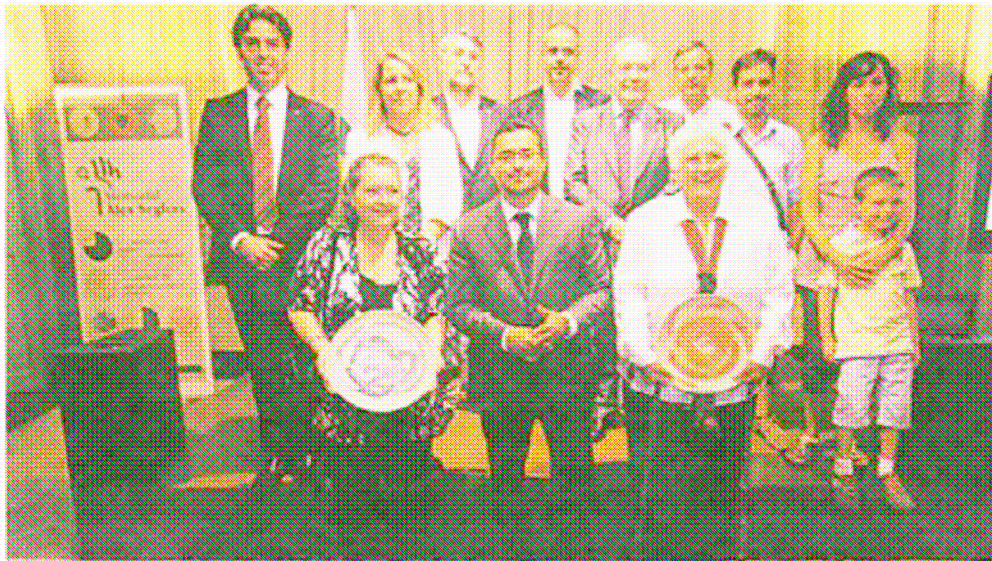
Premiats i membres del jurat a l'acte de lliurament del guardó