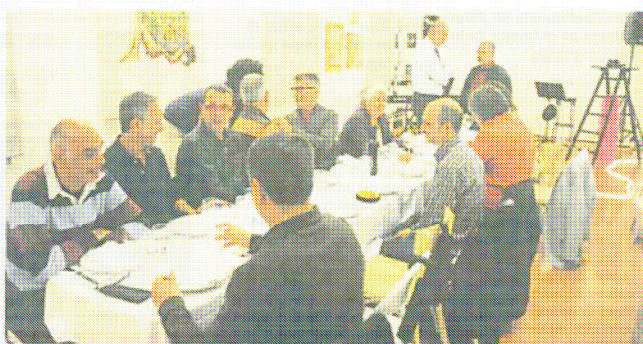
La Casa Duran (a dalt) va acollir l'acte institucional i l'Aliança Française el sopar i l'espectacle