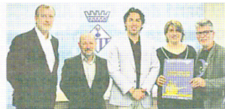
Representants de les entitats amb el regidor de Drets Civils

La resta del programa previst presenta la diversitat sexual i afectiva des de diferents espais com el cinema, les exposicions, les conferències i la festa. S'han programat pel·lícules recents sobre la sexualitat i l'adolescència com «Quinceañera» (2005) i