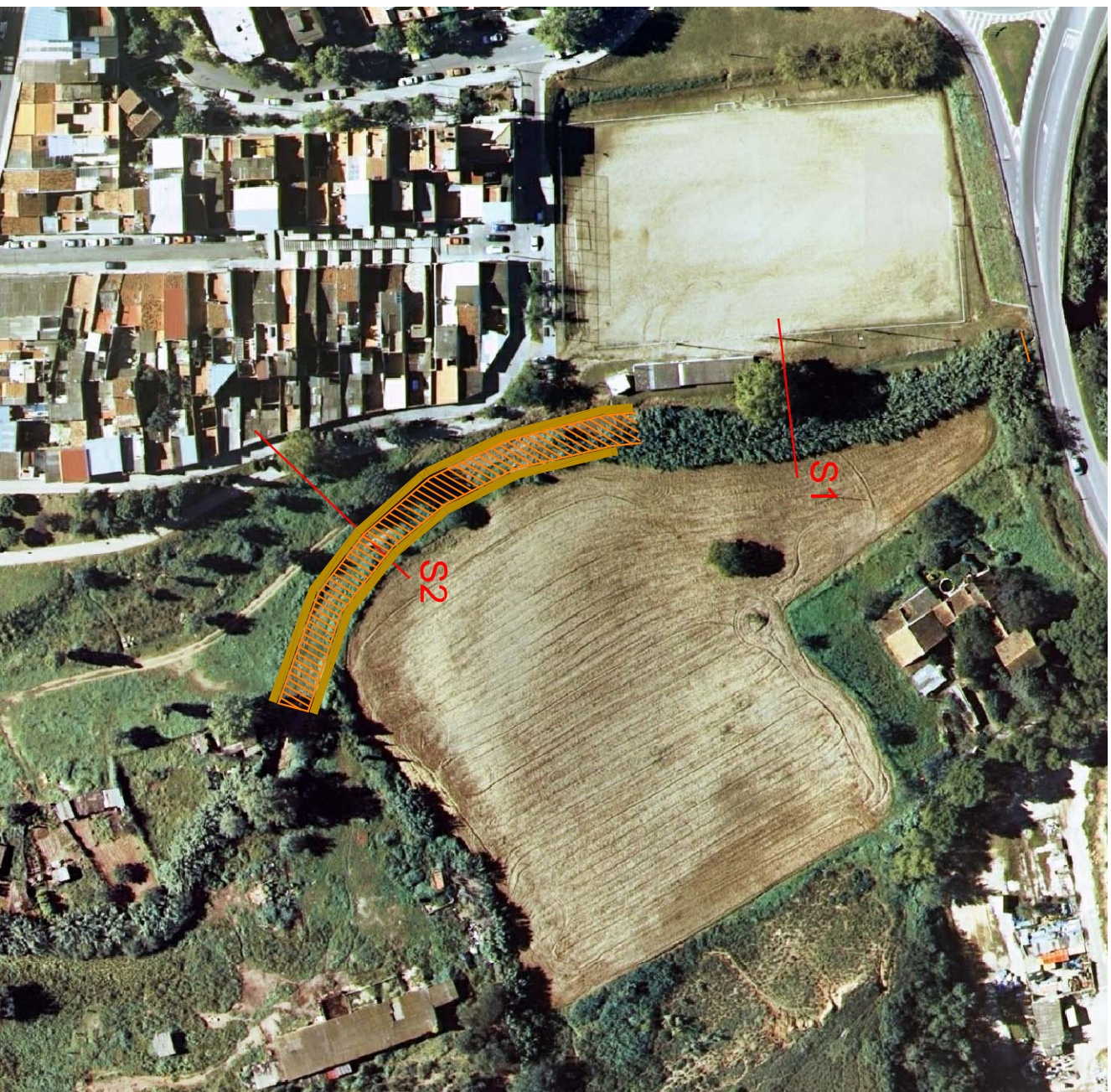
Talusos Zona excavada e 1:1500

La proposta consisteix en adoptar un seguit de mesures de contenció de la riera per a evitar les inundacions que es produeixen a l'alçada del camp de futbol, i en el meandre que es troba a continuació. La proposta tracia de rebaixar la base de la riera 1 metre per a delimitar el pas de l'alguia. Les terres sobrants es col·loquen en una mota per a evitar que sobresurti l'alguia durant les avingudes. D'aquesta manera es compensa el moviment de terres. Es distingeixen dos trams diferencials. En un primer tram tenim una secció de 5 metres d'amplada i 2 metres de profunditat, ambdós talussos a 45 graus. El segon tram es diferencia per tenir 2,5 metres de profunditat, i un parell de moles de terra artificial a ambdues bandes del meandre. Les seccions s'han calculat amb base al període de recurrència de 10 anys, de manera que no hi hagi inundacions.